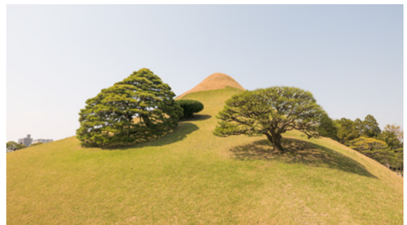
Suizenji Jojuen Garden, Kumamoto