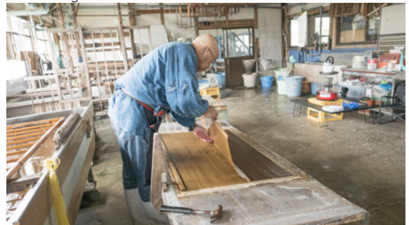
Papierfabriek in Yame-shi