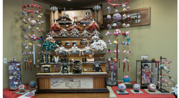
Hina Doll Festival In Yanagawa

Met veel dank aan Stichting Gerbrandy Cultuurfonds voor het vertrouwen en de financiële bijdrage.