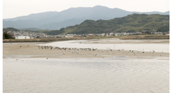
Buiten, de bamboe, stenen en zee, de directe omgeving van studio Kura