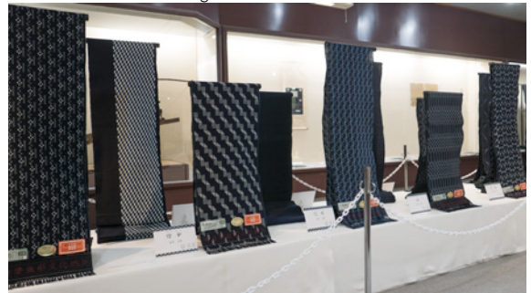
Textiel/indigo-festival in Kurume