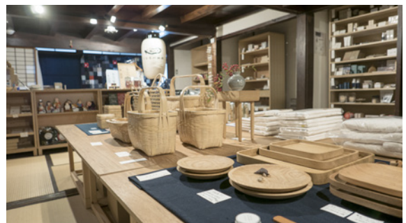
Unagi-no-Nedoko winkel in Yame-shi