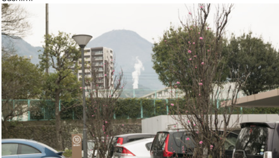
Beppu, stad met de vele onsen